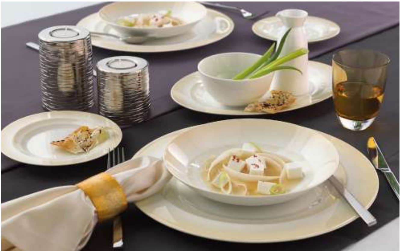
DECOR PATTERN SABLE 63053