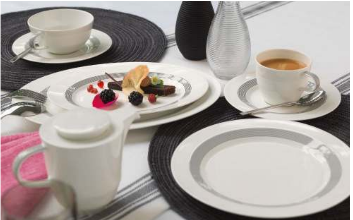
DECOR PATTERN ÉTERNITÉ 63051