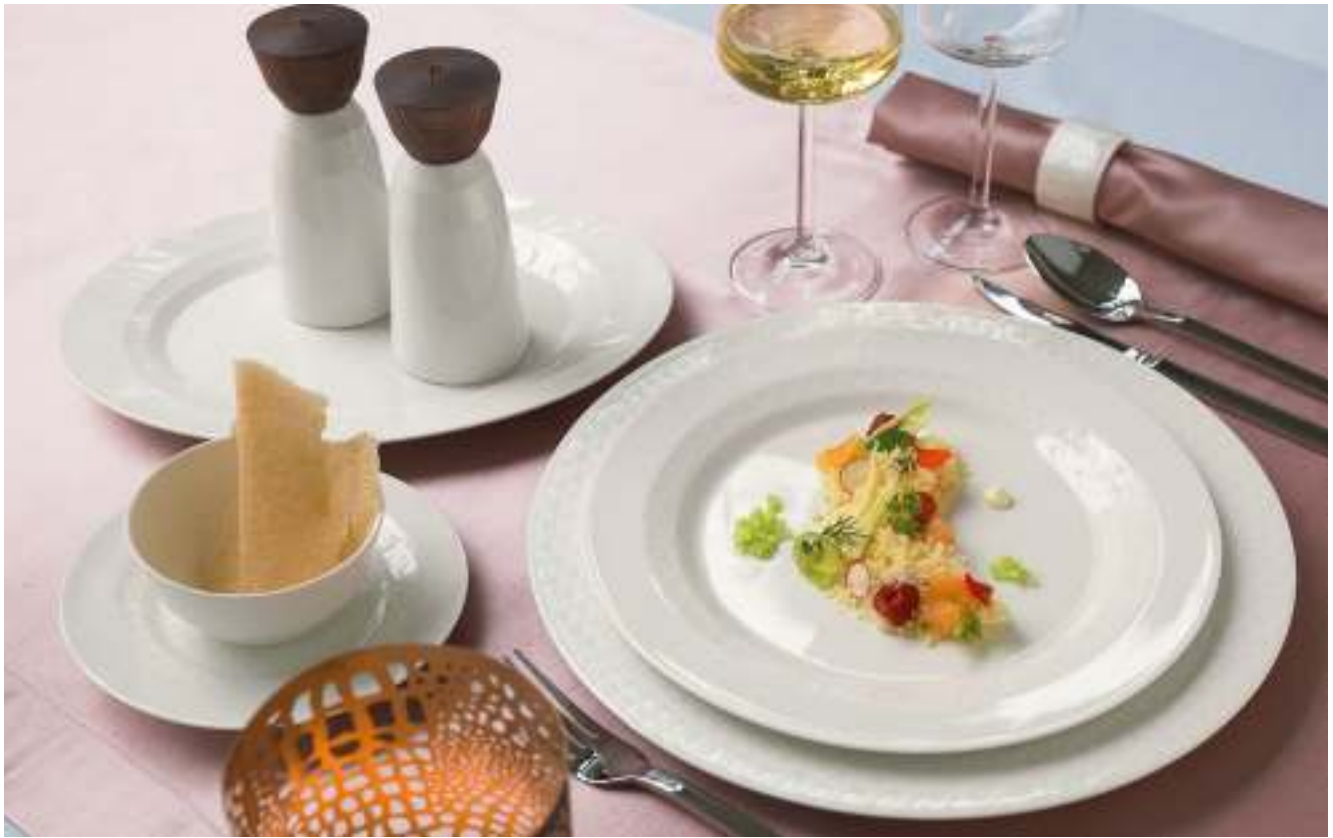
DECOR PATTERN MOULIN 63052