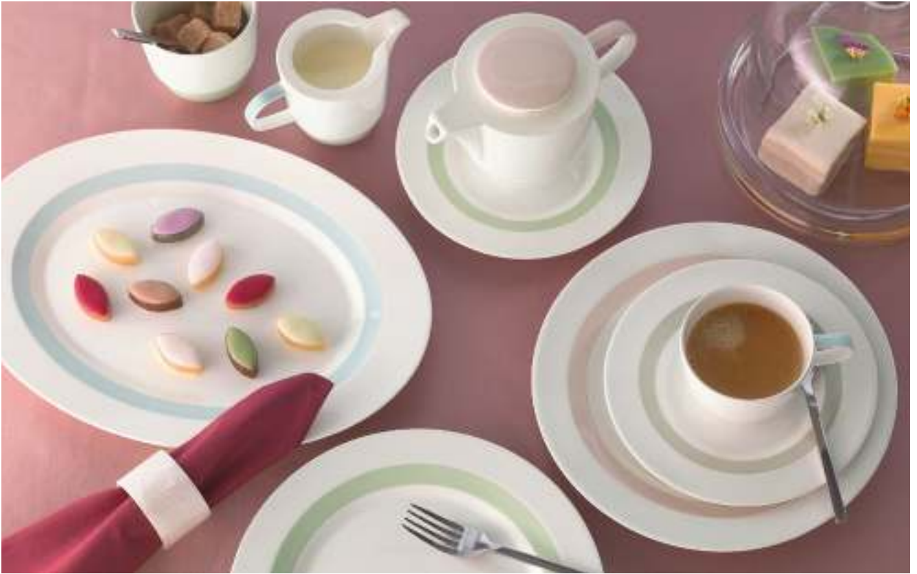
DECOR PATTERN POUDDRE VERTE 63054 DECOR PATTERN POUDDRE BLEUE 63055 DECOR PATTERN POUDDRE ROSÉE 63056 DECOR PATTERN POUDDRE PIERRE 63057